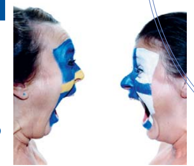
Nya Finska Teatern, Stockholm: ur teateruppsättningen Oy Saunavätstugan Ab