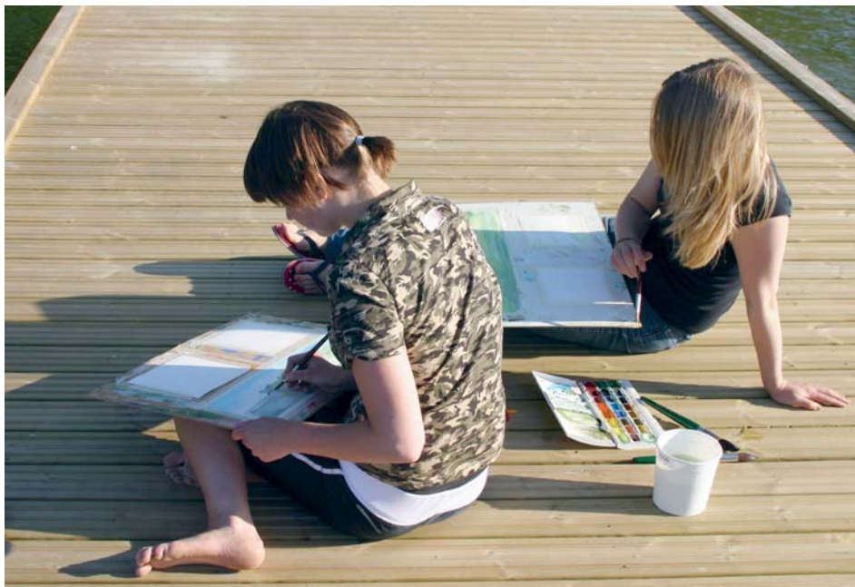
Bildkonstläger för finländska och svenska ungdomar sommaren 2005, Hanaholmen – kulturcentrum för Sverige och Finland, Esbo, Finland.

Utöver WVS-studierna utgår rapporten från en tilläggsundersökning som initierats av Kulturfonden för Sverige och Finland. Den gjordes i direkt anslutning till den senaste WVS-mätningen. Syftet var att få mer material om finländares och svenskars uppfattningar och kunskaper om varandra, om deras förtroende för och kontakter med grannland och grannfolk på andra sidan Bottniska viken och om synen på samarbete i framtiden. Svarsfrekvensen blev lägre än vid själva WVS-mätningarna, 52 % i Finland och 74 % i Sverige. Varför? Svenskarnas högre närvaro kan ”vara något mer påverkad av ett allmänt intresse för sådana samhällsfrågor som WVS-undersökningen handlade om”, gissar forskarna. Det behöver alltså inte betyda att svenskarna hyste ett mer specifikt intresse för just Finland än finländarna för Sverige.