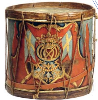
Utställningen 1809 – Rikssprängning och begynnelse. 200-årsminnet av Finska kriget.

Egentligen är Petterssons-Nurmelas rapport ett slags kommentar till frågan om anekdoten ger en rättvis bild av olikheterna mellan svensk och finsk mentalitet. Erkki Virta drog den för att illustrera en vanlig uppfattning om finländares självbild; den präglas av mindervärdighetskänslor och oro över vad andra länder kan tycka om